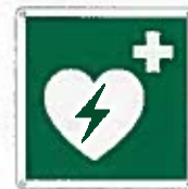
Defibrillatore esterno di emergenza E010 ●