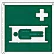
Barella di emergenza E013 ●