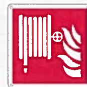
Lancia antincendio - nospa F002 ●