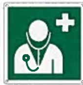
Dottore E009 ●