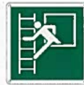
Finestra di emergenza con scala E016 ●