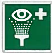
Lavacchi di emergenza E011 ●