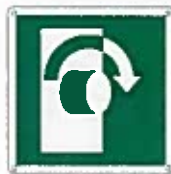
Girare la maniglia in senso orario E019 ●