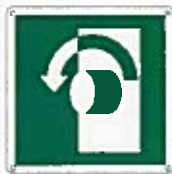
Girare la maniglia in senso orario E018 ●