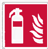
Estintore F001 ●