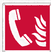
Telefono emergenza antincendio F006 ●