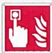
Allarme antincendio F003 ●