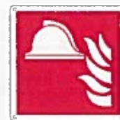
Attrezzature antincendio F004 ●