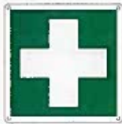
Primo soccorso E003 ●