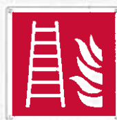
Scala antincendio F003 ●