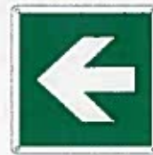
Freccia a destra/sinistra