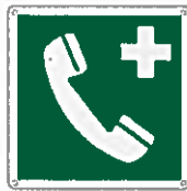
Telefono di emergenza E004 ●