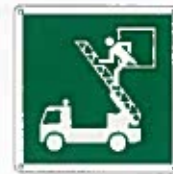
Finestra di recupero e salvataggio E017 ●