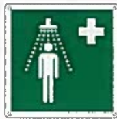
Doccia di emergenza E012 ●