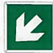
Freccia diagonale a destra/sinistra