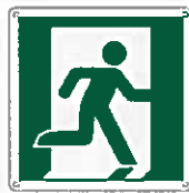
Uscita di emergenza a destra E002 ●