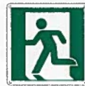
Uscita di emergenza a sinistra E001 ●